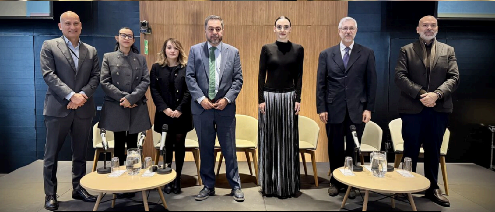
Fotografías: Primer Encuentro Nacional de Polos de Desarrollo Económico para el Bienestar.